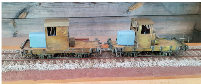
BDR Plateau Haxo Modèle version cabine longue et cabine courte. Modèles en cours de montage ne comportant pas toutes les pièces.