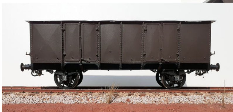
Version non freinée