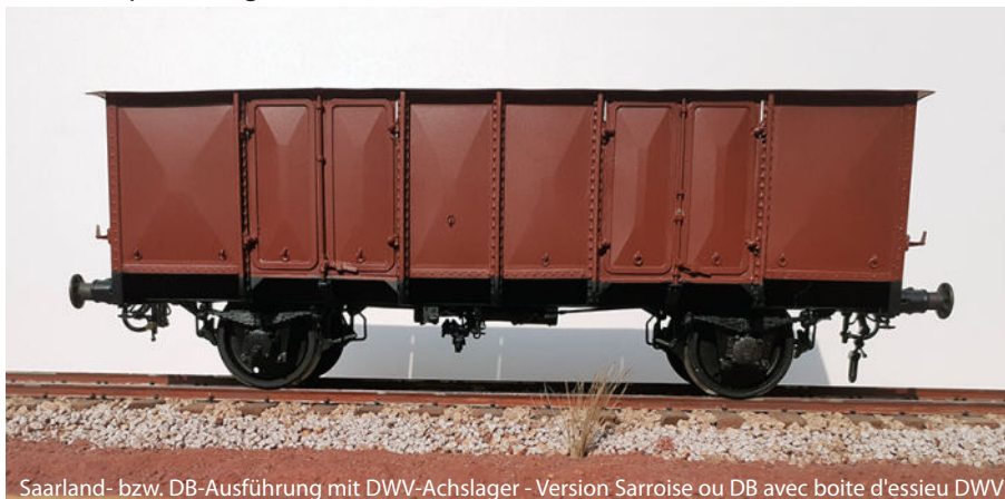
Saarland- bzw. DB-Ausführung mit DWV-Achslager - Version Sarroise ou DB avec boîte d'essieu DWV

Ein Teil der Flotte wurde in die Europ-Triebwagenflotte überführt.