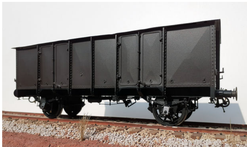
Version avec frein