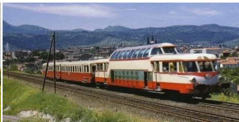
Autorail Panoramique et sa remorque

Le démarrage du premier projet serait prévu pour cette fin année (dans la continuité de l'étude de la 2D2 9100 qui devrait alors passer en production).