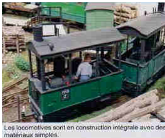
Les locomotives sont en construction intégrale avec des matériaux simples.