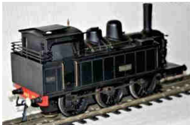
030T de Dan Chay

Une 030 BOER par FOURNEREAU; modèle des années 60. Le moteur T 55 occupe la totalité de la cabine. Ce modèle relativement facile à trouver et peu onéreux.