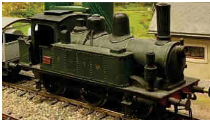
030TB6 CATM de mon père