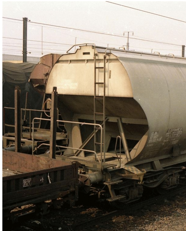
Rambardes droites des wagons de types 2 et 3

Des photographies des wagons réels ayant servi à la définition des différents modèles seront disponibles prochainement sur le site train-modele.fr .