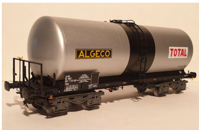
Wagon citerne ANF ALGECO TOTAL