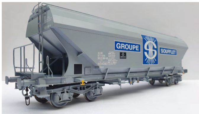
Wagon céréalier à faces planes SOUFFLET