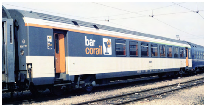
VTU A5rtux Corail sigle allongé référence V4.1a

De nouvelles références demandées avec insistance ont été ajoutées en V1, V2 et V3. Il s'agit des voitures à portes louvoyantes coulissantes (plc) du programme VTU 82, identiques aux autres à la différence des portes qui affleurent les faces latérales, avec des emmarchements et des joints de fenêtres différents.