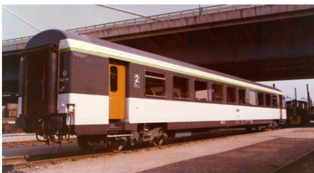
VTU B11 Corail sigle allongé référence V2.1a