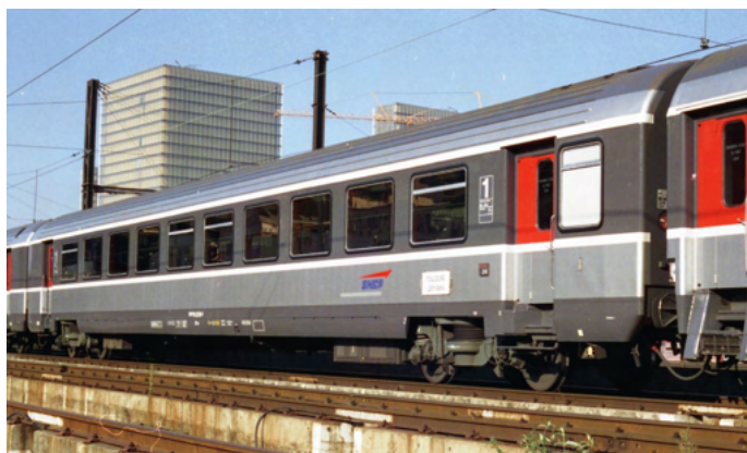
VTU A10 Corail + sigle Desgrippes référence V1.2