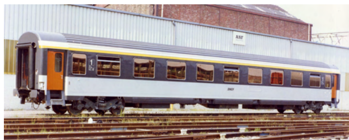
VU A9u sigle allongé référence V5.1a

Ici encore, chaque référence est complétée, identiquement aux VTU, par un chiffre pour définir la livrée, éventuellement suivi d'une lettre minuscule pour caractériser le type de logo.