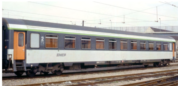
VU B11u sigle Tallon référence V6.1b

Le système de réservation fera appel, outre le montant forfaitaire d'engagement de 150 euros par voiture (250 euros à compter du 1 er décembre 2024), à un financement étalé dans le temps :