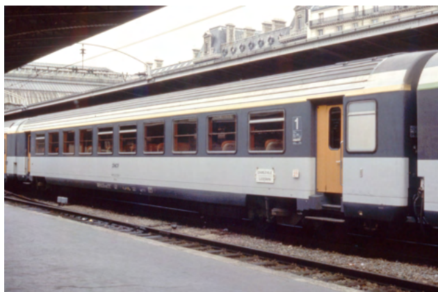
VTU A10 Corail sigle allongé référence V1.1a

Le code suivant la référence de base est constitué d'un chiffre qui caractérise la livrée. Ainsi par exemple, V1.1 caractérise la livrée Corail classique, tandis que V1.2 est relatif à la décoration Corail +, et V1.3 à la "Nouvelle décoration". Une lettre minuscule a, b ou c peut préciser le type de logo (allongé, Tallon, Desgrippes, Carmillon, etc ...) pour une livrée donnée.