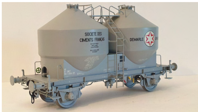
Wagon silo Ciments Français époque IV

Aujourd'hui, après trois ans et demi d'existence, TRAIN MODÈLE a tenu ses promesses. Le démarrage a été progressif, nécessaire pour orienter le choix des modèles à fabriquer en fonction des attentes des modélistes. Ainsi, TRAIN MODÈLE a d'abord produit les petits wagons silos à deux essieux, puis les locomotives BB 26000 - avec pour ces dernières en option, une digitalisation avancée ZIMO (*) ainsi que des pantographes motorisés - puis ce fut le tour des wagons citernes ANF à bogies, puis l'arrivée des BB 9400/30001, et enfin dernièrement celui des wagons céréaliers à faces planes. Soit cinq réalisations en trois ans, avec un respect au plus près des délais annoncés lors de leur souscription, avec une information régulière du déroulement, parfois plus long que prévu, de certaines d'entre elles.