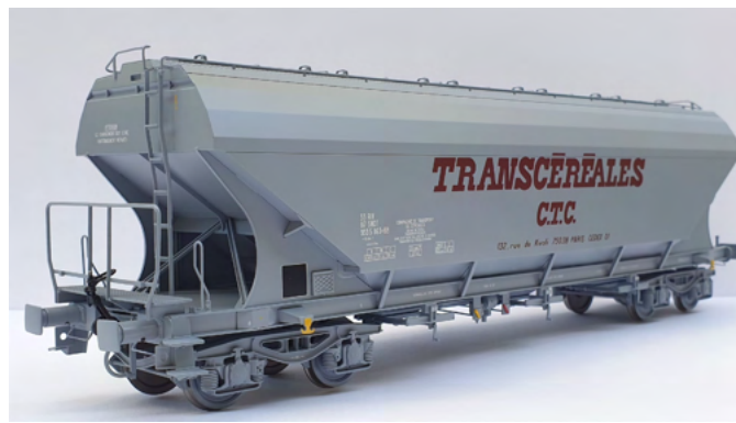
Wagon céréalier à faces planes TRANSCEREALES CTC

Les retours des amateurs intéressés ont confirmé que la voie choisie était la bonne et qu'il fallait persévérer. La confiance et la compréhension de la majorité des personnes intéressées par le modélisme de qualité au 1/43,5, organisées autour du système de souscription proposé permettant entre autres de disposer avec certitude de la version désirée, n'ont jamais fait défaut. Que tout le monde en soit ici remercié.