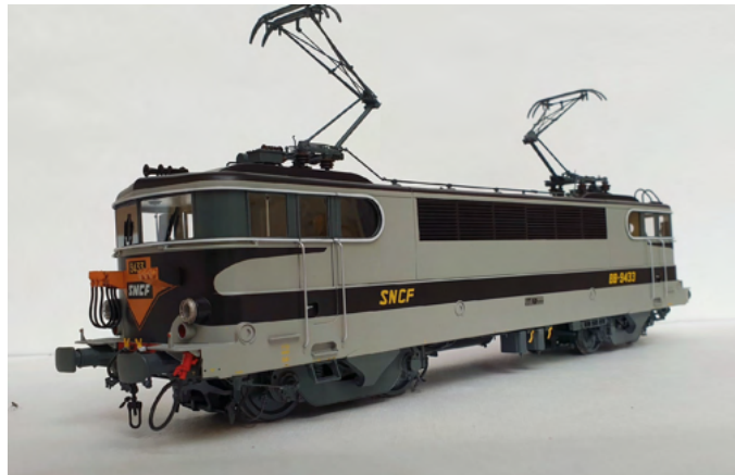
Locomotive BB 9433