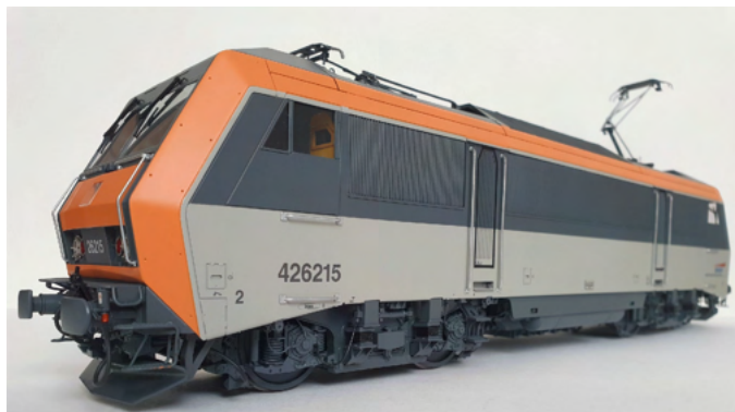
Locomotive SYBIC BB 26215