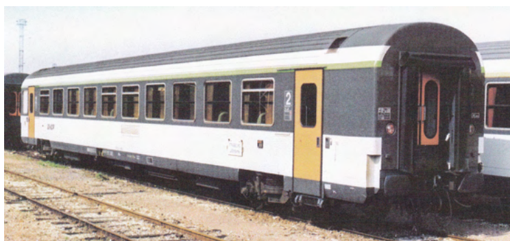
Voitures Corail VTU 82 à portes louvoyantes coulissantes (plc)

Les Vu sont caractérisées par les références de base V5 à V10, avec la répartition suivante :