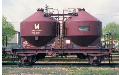
V5 - Transport de sable sec - Epoque IV