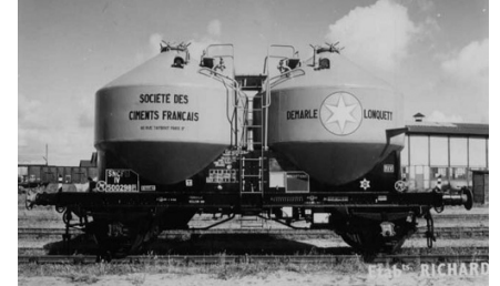
V6 - Ciments Français - Epoque III