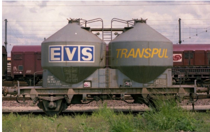
V4 - EVS Transpul - Epoque IV