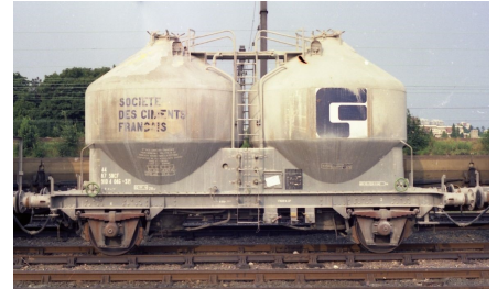
V3 Ciments Français - Epoque IV