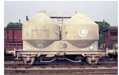
V12 - Ciments Français - Epoque IV