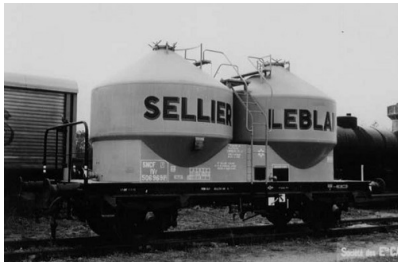
V7 - SELLIER LEBLANC - Epoque III