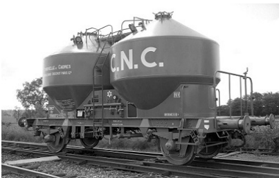
V10 - CNC - Epoque III