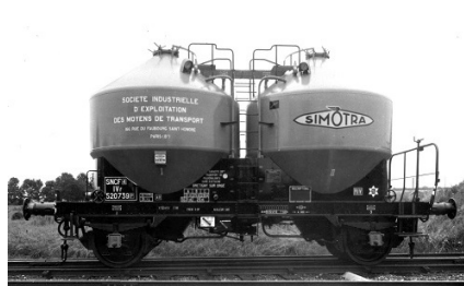
V8 - SIMOTRA - Epoque III