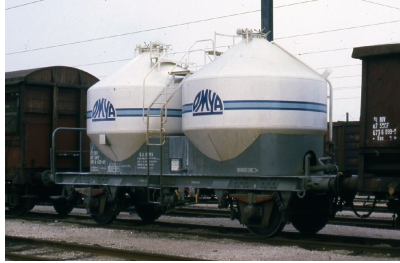
V2 - OMYA - Epoque IV