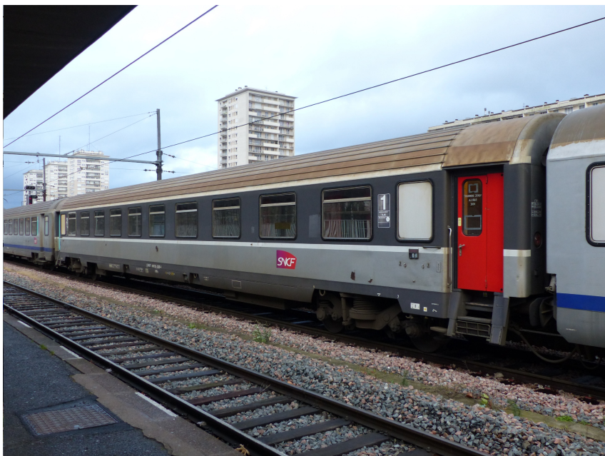
Voiture Corail VU mixte A4B6 en décoration époque V, logo carmillon, portes entièrement peintes (rouges en 1 ère , vertes en 2 ème )

- les voitures Corail , avec une finition inégalée et le strict respect des particularités et des différentes livrées, avec les VTU des deux classes ainsi que la voiture bar Corail, et les VU dont la mixte fourgon était présente partout, tout comme les voitures couchettes, sans oublier le fourgon MC76 dont de nombreux exemplaires ont été vendus en Suisse aux CFF et au BLS. Ce programme est important et s'il est validé, glissera vraisemblablement sur deux années.