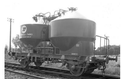
V9 - CNC/SMTS - Epoque III