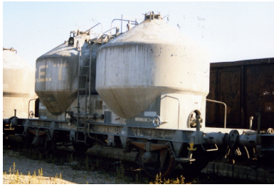
V1 - CET - Epoque IV