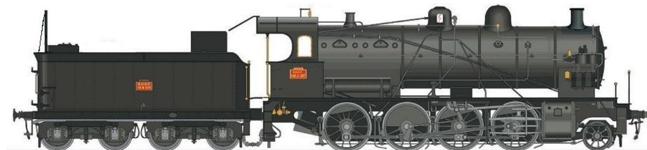
Réf 140-01 : 140 C 70 + tender 18 B 64 (région Est)

Description : livrée noire intégrale – soupapes d'origine – porte de boîte à fumée plane – échappement Nord