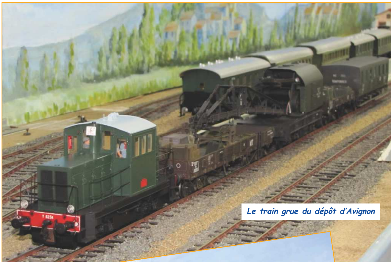
Le train grue du dépôt d'Avignon