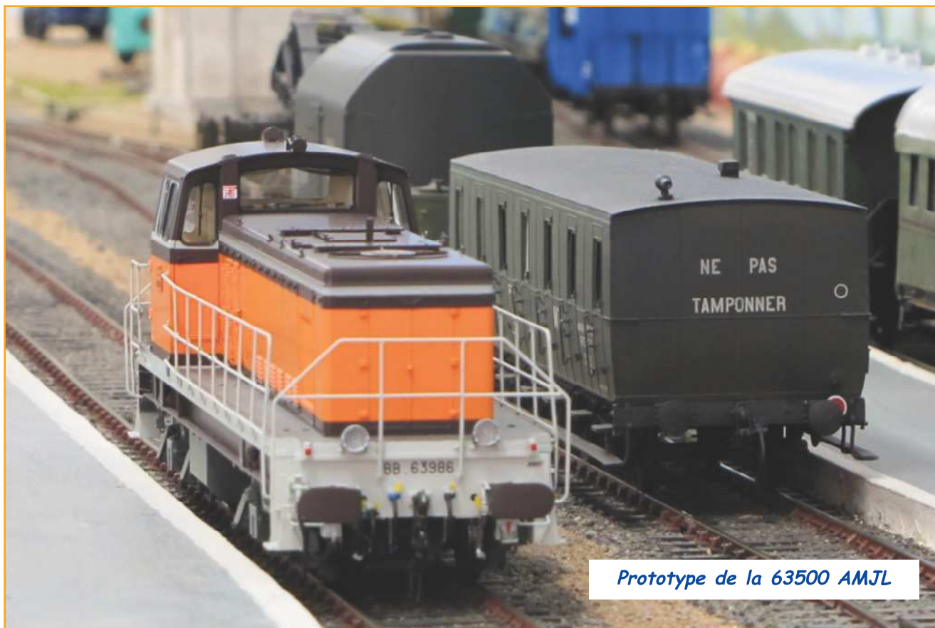
Prototype de la 63500 AMJL