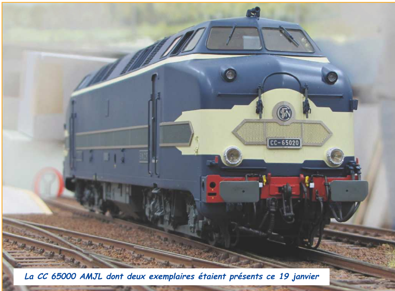
La CC 65000 AMJL dont deux exemplaires étaient présents ce 19 janvier

La désignation des modèles en Zéro de l'année par la Fédération Française de Modélisme Ferroviaire est également évoquée. Chaque membre est invité à exprimer ses préférences. Au niveau du matériel roulant, les CC 65000 AMJL, 3 pattes Elettren et Grue Caillard AMJL sont évoquées