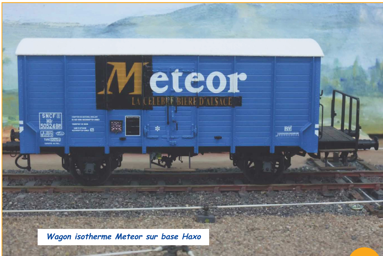
Wagon isotherme Meteor sur base Hxo