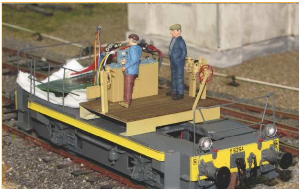
Les locotracteurs de Christian :