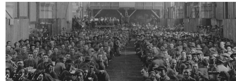
Grand hall de la gare transformé en réfectoire en 1918

Concert années swing, par le Classic Jazz Band (trompette, saxo, trombone & banjo).