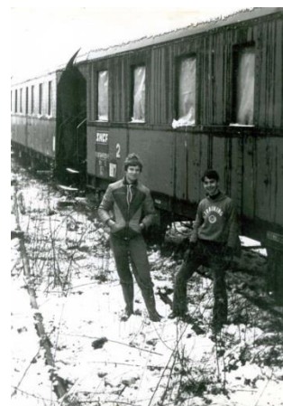
Deux jeunes membres du CFTV devant les C6t juste après leur arrivée.